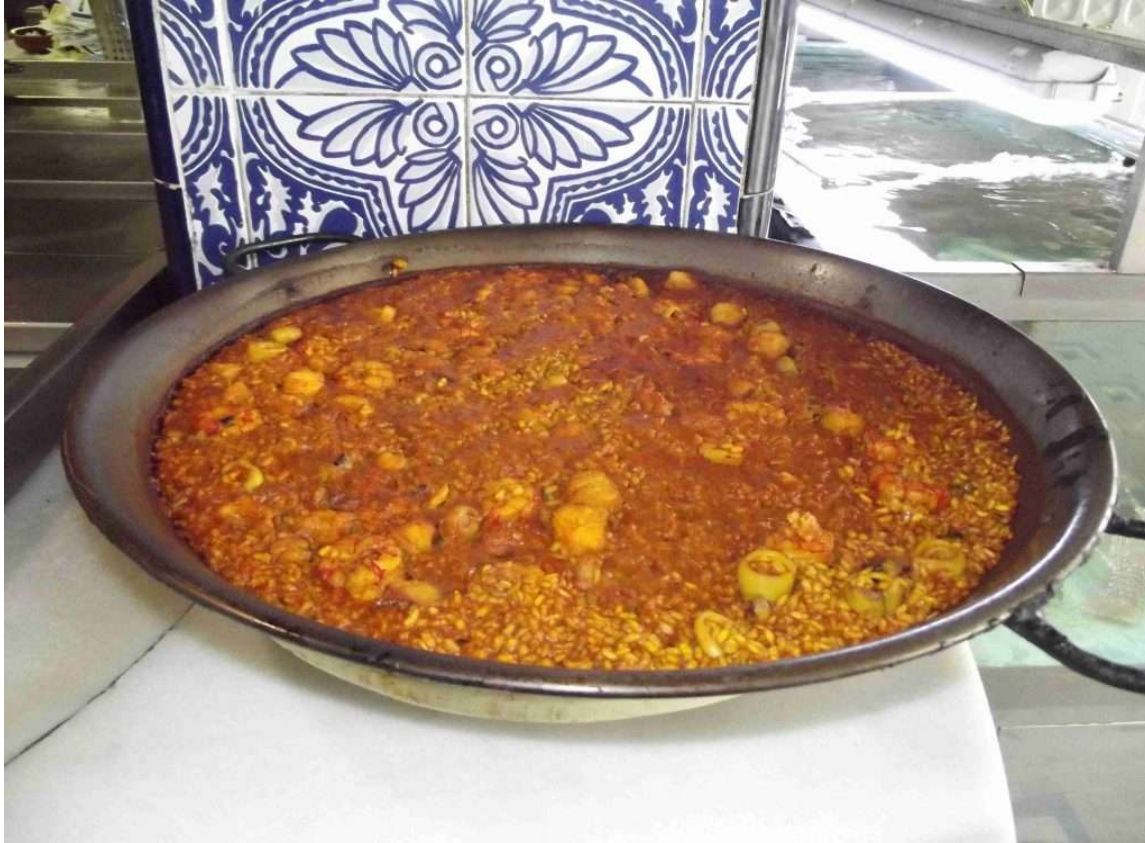
La Paella valenciana

Il tempo libero sarà sempre più "occupato" da tanti svaghi nei bar, ristoranti e spazi culturali alternativi. Nel Gran Martínez, un'ex farmacia della fine del XIX secolo, buona musica e cocktail. A Villa Indiano, con vista sull'orto e la Sierra Calderona, un ristorante di cucina tradizionale valenciana con un giardino culturale di 2.500 metri quadrati dove si può assistere a concerti o degustare una rinfrescante horchata nei mesi estivi, in un'atmosfera rilassata. Nella zona commerciale della città il nuovo ristorante Begin unisce prodotti locali e prodotti biologici oltre al rispetto per il benessere degli animali.