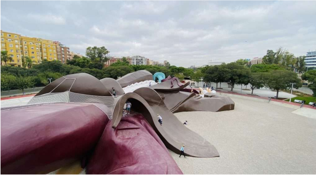
Il gigante Gulliver

I più piccini saranno felici, il popolare parco di Gulliver dei giardini del Turia riapre completamente restaurato. Si potrà di nuovo scivolare nella giacca del gigante Gulliver, arrampicarsi tra la barba o correre tra le sue gambe. Nello spazio interno del gigante è stata creata una nuova zona giochi per i più piccoli, che ancora non possono salire sul Gulliver.