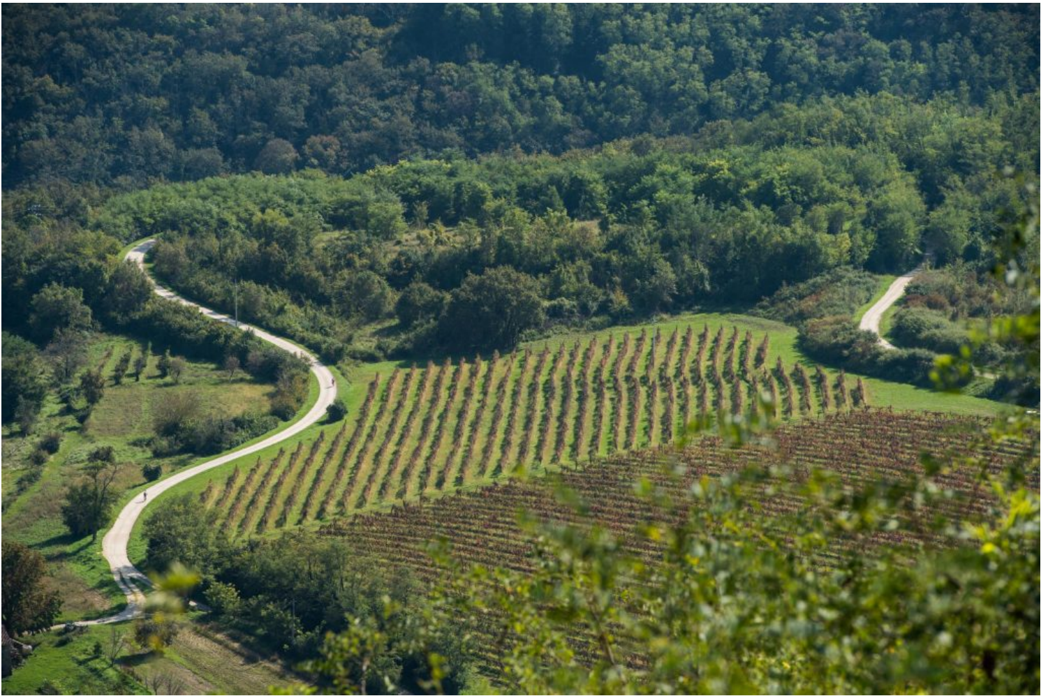
Motovun e dintorni

La destinazione turistica croata è una meta desiderabile ed è individuata come una destinazione dove tutti gli ospiti possono trovare quello che desiderano fare. L'obiettivo dell'Ente Nazionale Croato per il Turismo è di mantenere questa invidiabile posizione di visibilità. Il mercato italiano è tradizionalmente tra i primi 10 da cui provengono i turisti, cosa che si è ripetuta anche negli ultimi due anni. Nel 2023 la Croazia manterrà questo obiettivo di offrire una vasta gamma di esperienze turistiche autentiche e di alta qualità a diversi segmenti della domanda turistica. Vicinanza, sicurezza, varietà, ma anche un ulteriore sviluppo basato su un approccio sostenibile, ecologico e digitale, questi i cardini su cui si base il programma del prossimo anno. Inoltre, un elemento importante nella promozione per il prossimo anno sarà l'ingresso della Croazia negli accordi di Schengen e nella zona euro, cosa questa che faciliterà ulteriormente l'apertura al mercato italiano ed europeo. L'Ente Nazionale Croato per il Turismo in Italia festeggia a Milano i risultati ottenuti nel nostro Paese, con un evento per presentare la cucina istriana. L'Istria è un regione turistica ambita dai turisti italiani per la tradizione basata sulla sua storia antica, le esperienze autentiche, la gastronomia tipica e per la verde costa bagnata dal mare limpido. Per i cultori del mangiare bene e bere meglio, la Croazia ha