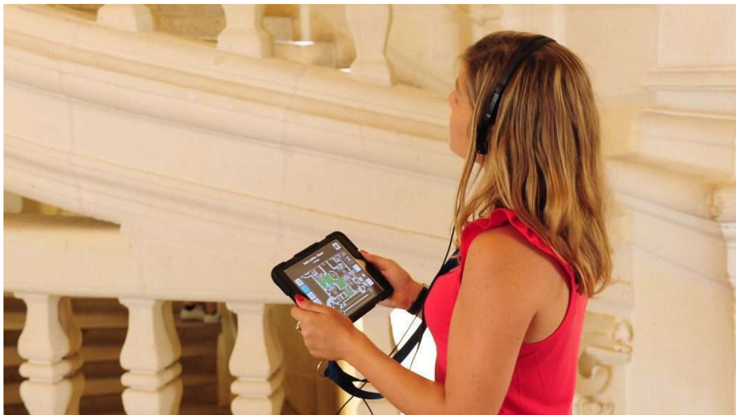
Léonard de Serres - Domaine National de Chambord

l' HistoPad , un tablet che offre una nuova esperienza di visita virtuale, sarà presto disponibile in cinque Castelli della Loira: Chambord, Blois, Loches, Amboise e Chinon. Innovazione tecnologica di recente introduzione, l'HistoPad è un tablet dotato di un'applicazione capace di far immergere virtualmente il visitatore in alcuni spazi di un luogo storico. Navigando col tablet fornito all'ingresso il visitatore vede l'ambiente che lo circonda com'era in epoca rinascimentale, oppure nei secoli precedenti, fornendo informazioni su fatti storici, dettagli architettonici, oggetti e personaggi del luogo in cui si trova.