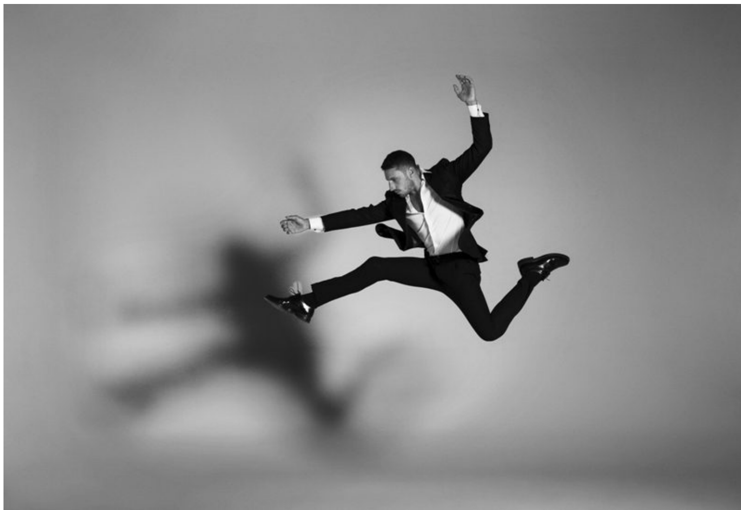
Costantino Imperatore fotografia Monica Irma Ricci

L'associazione Stefano Francia EnjoyArt organizza a Terni il 30 aprile la quarantesima Giornata Mondiale della Danza un convegno e la premiazione del concorso multi arte "DILLO ALLA DANZA" con il patrocinio del CID UNESCO e del Comune di Terni