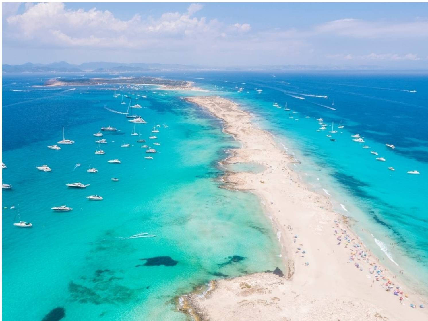
Formentera, ses illetes

RTS vuole contribuire alla promozione del turismo, promuovendo iniziative ecosostenibili e percorsi enogastronomici, sostenendo e favorendo la partecipazione degli operatori del settore. Turespaña, in occasione di Roma Travel Show 2022, promuove anche il Centro Multimediale Interattivo, situato in Piazza di Spagna, dove si svolgono attività di promozione delle destinazioni spagnole attraverso eventi periodici consultabili sul sito: www.events.esperienzaspagna.it