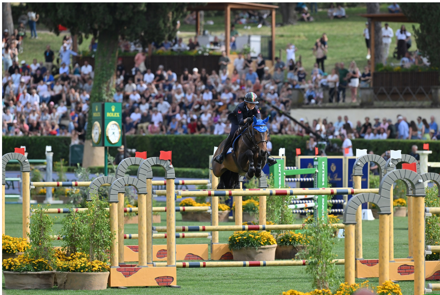
Roma 29/05/2026 100 Piazza di Siena