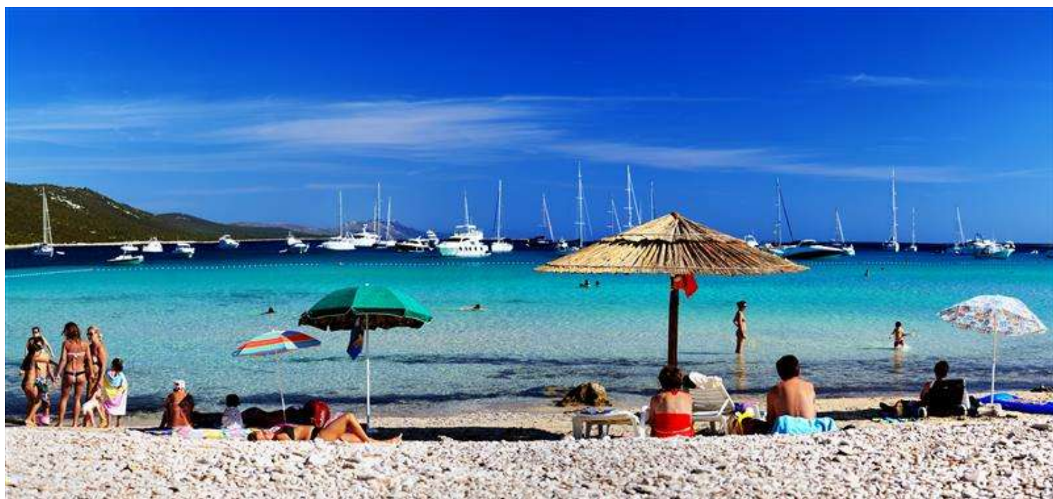
Dugi otok