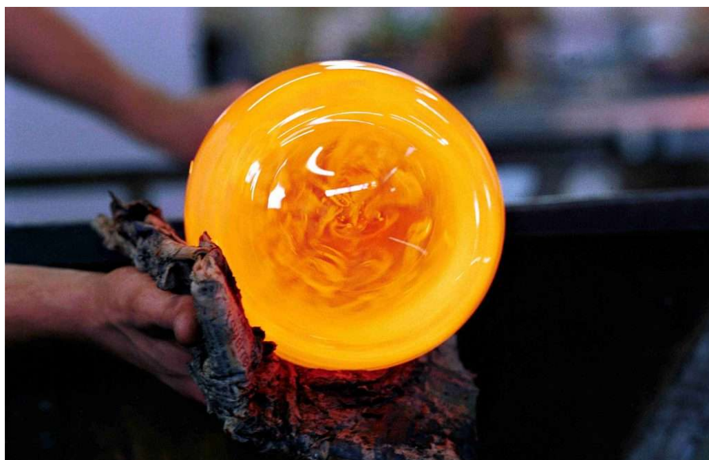
Vetreteria artistica di Biot

Hyères, Tolone e la Provenza Mediterranea Sono un mix perfetto di natura e cultura. Fra le novità 2023 a Hyères il Musée du Niel e Fort du Pradeau, centro interpretativo di fronte alle Iles d'Or, abbandonato e chiuso al pubblico da diversi decenni, e a Villa Carmignac, sull'isola di Porquerolles, la mostra dell'anno: «L'isola interna ». Turismo green e slow con il nuovo sentiero di mobilità dolce e sostenibile alle Saline dei Pesquiers a Hyères e il Parc de La Loubière a Tolone, ex area industriale abbandonata trasformata ora in un giardino mediterraneo di 16.000 m 2 .