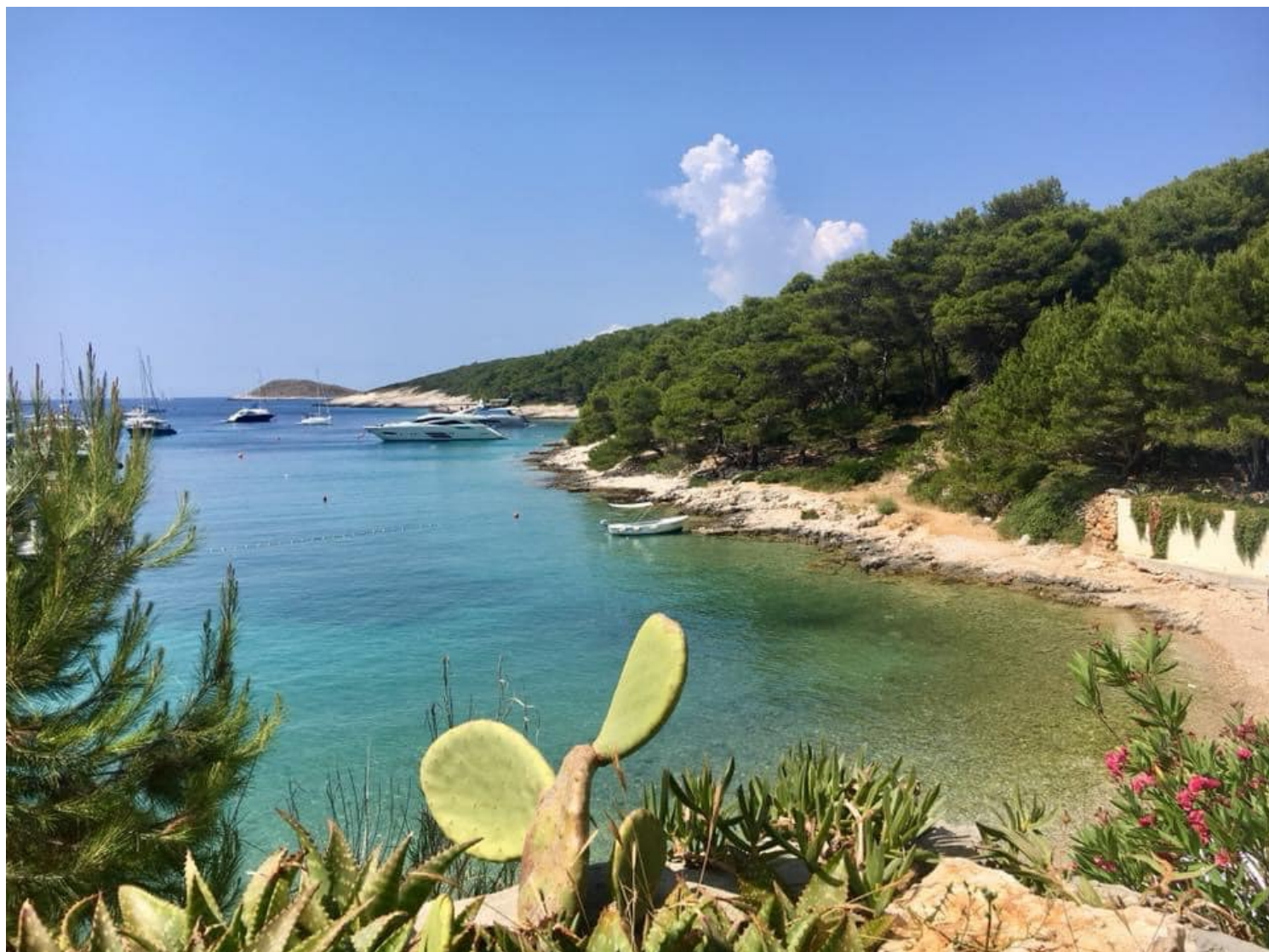
Meneghello_White villa view