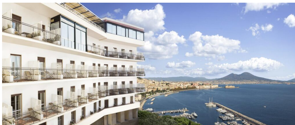
Hotel Paradiso di Napoli