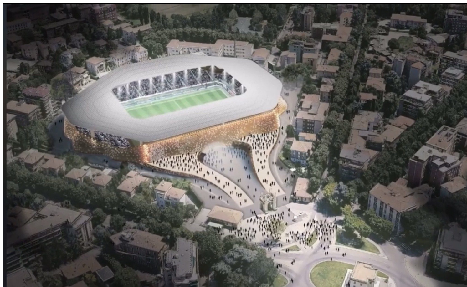
stadio Tardini di Parma

La società INIZIATIVA per generare valore aggiunto di esperienze e competenze nel campo del corporate finance della finanza agevolata del business advisory e per realizzare infrastrutture pubbliche o aziendali