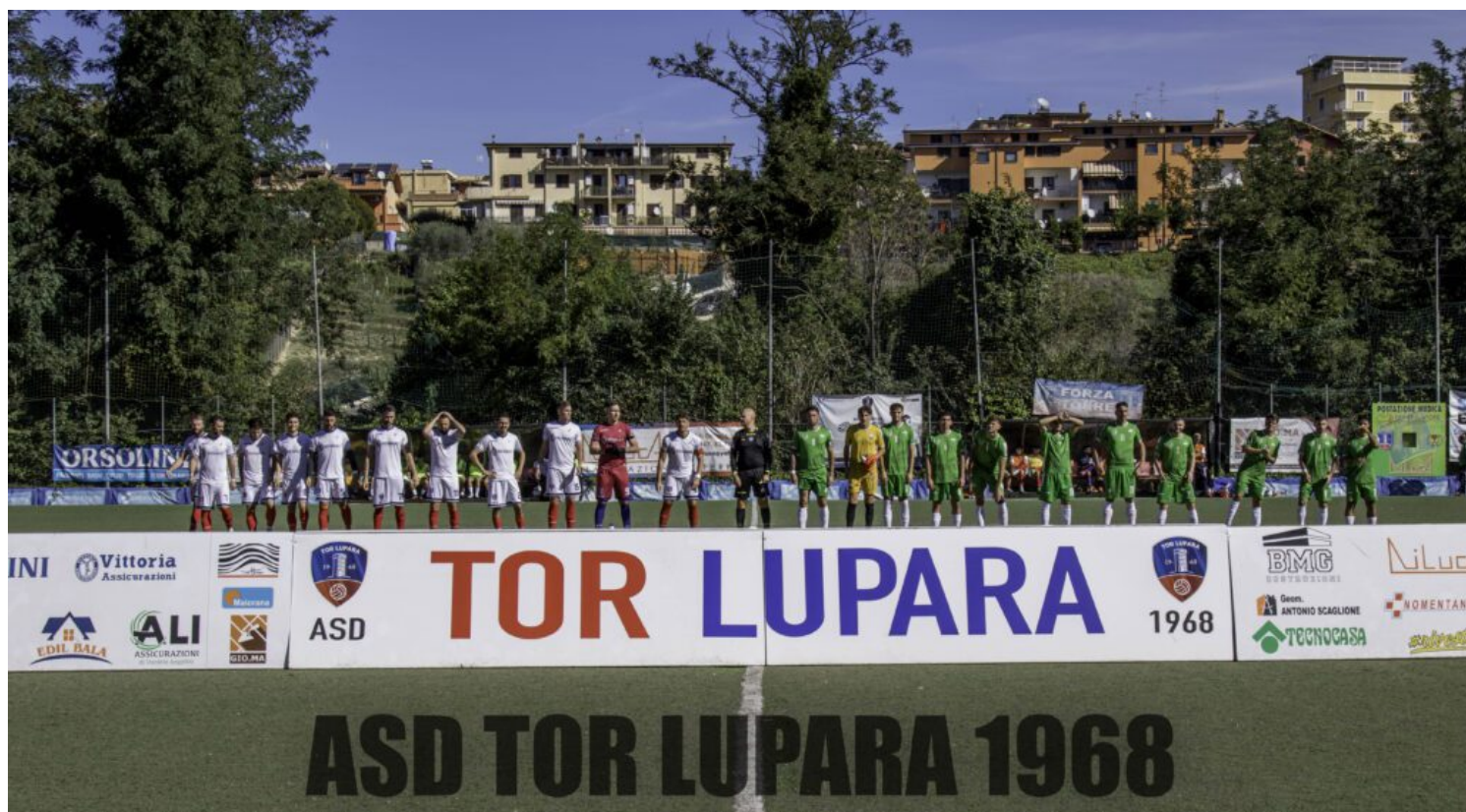
STADIO COMUNALE "DOMENICO MAMMOLITI" - FONTE NUOVA

lavoro di copertura, sicuramente rispetto a domenica scorsa che eravamo in vantaggio e siamo stati raggiunti all'ultimo minuto, oggi abbiamo visto un' ottima reazione di tutta la squadra , sotto di 2 reti ad 1 abbiamo pareggiato, questo ci interessava e sono soddisfatto".