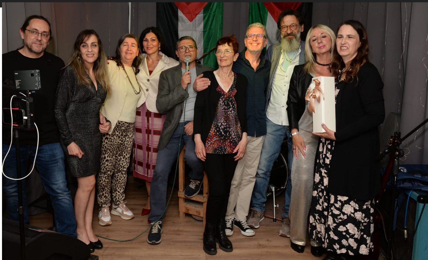
Amici di Cadenze Letterarie