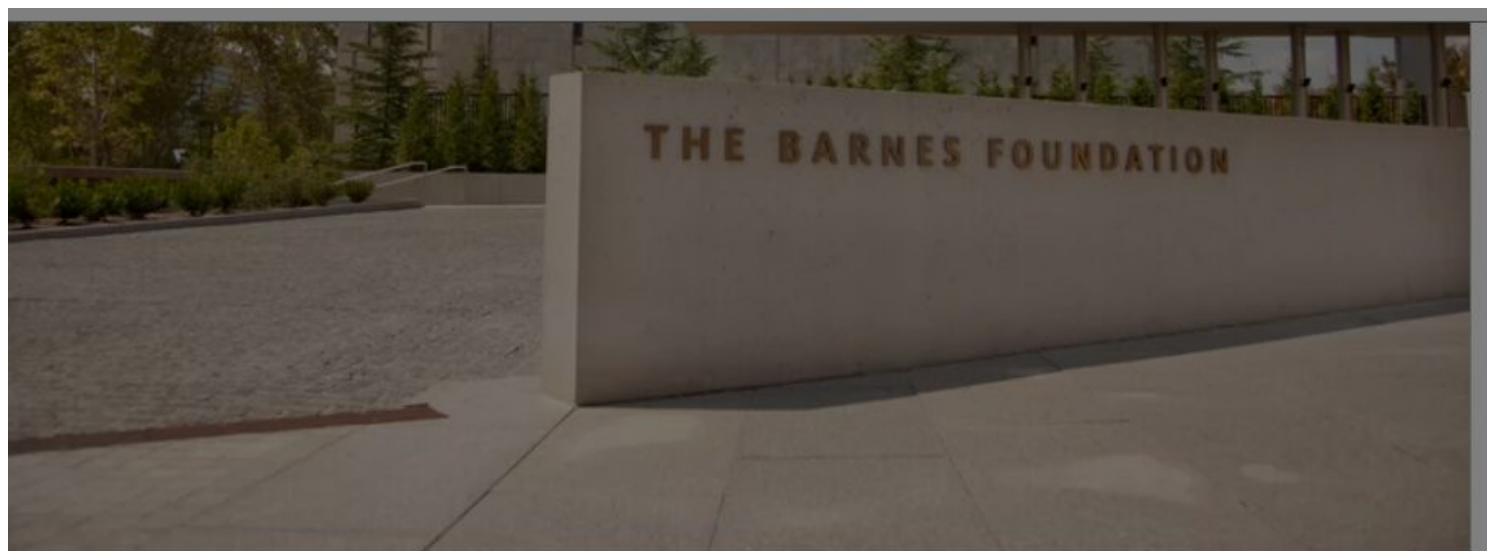
Barnes Foundation.

Questi due prodotti sono quelli che hanno consentito a due uomini, anzi a un uomo e a una coppia, di mettere assieme nel corso delle loro esistenze le maggiori raccolte di opere d'arte al mondo, fino ad oggi, per qualità e quantità: un farmaco per gli occhi e una delizia del palato hanno procacciato i mezzi finanziari giganteschi per permettere a questi personaggi la loro impresa e allo stesso tempo assicurare alla società un apporto cognitivo e culturale e estetico di primissimo significato. Lo spazio mi consente di ricordare solo i nomi e qualche dettaglio, sufficienti però per aprire al cultore interessato la via dell'approfondimento: c'è da sbalordire e apprendere! E non tanto per le cifre spese o per le quantità di opere accumulate, quanto principalmente per le finalità a fondamento del loro impegno, contribuire all'acculturamento e quindi all'avanzamento della società: la bellezza in tutti i suoi aspetti e forme ne è, in effetti, la pietra miliare, da sempre, disponibile a tutti.