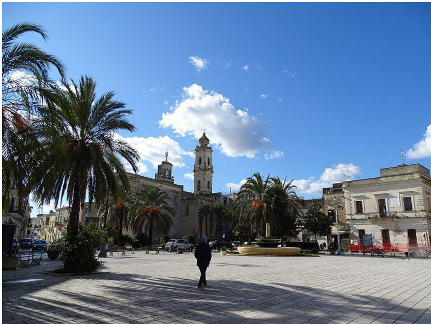
Cavallino il campanile moresco

Un video di Carmen Mancarella voluto dalla Città di Cavallino per restare accanto ai tanti viaggiatori e giornalisti che nel passato sono stati a Cavallino e Castromediano e che continuano ad amare con il desiderio di ritornarvi quanto prima