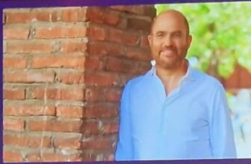
MASSIMO GRAMELLINI SCRITTORE, GIORNALISTA, PRESENTATORE